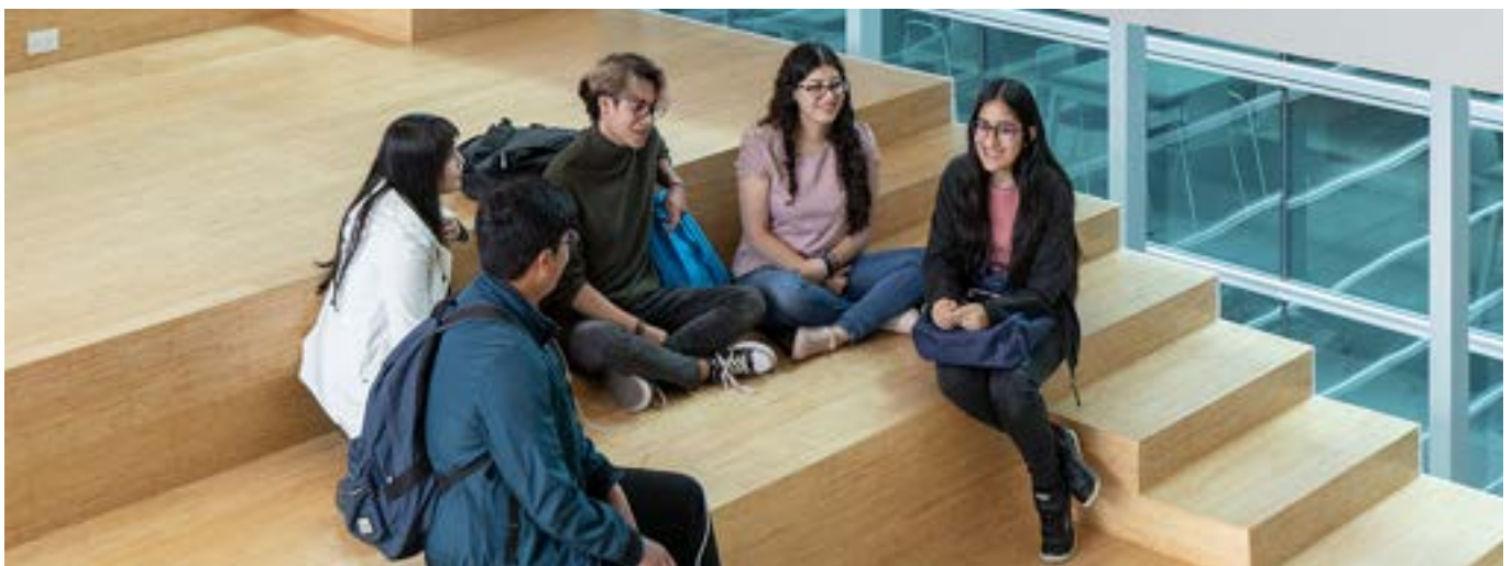
Instalaciones en la biblioteca Campus UDLAPark ala este