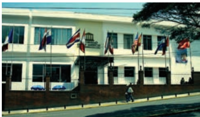
Campus Colón 1995

En noviembre de 1995 fue aprobado el funcionamiento de la Universidad de Las Américas (UDLA) mediante Decreto Ejecutivo No. 3272, dictado por el Presidente Constitucional, Arq. Sixto Durán Ballén, publicado en el Registro Oficial No. 832 del mismo año.